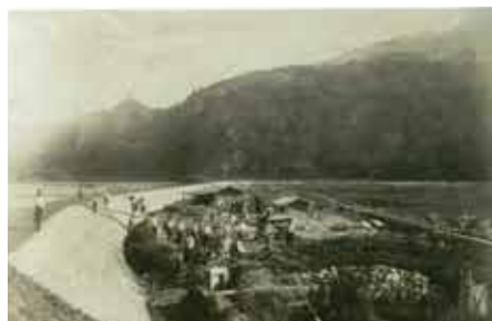
堤防の内側工事の様子 (着工1928年12月 竣工1936年10月) 相模湖水没旧勝瀬地区居住者会発行『湖底への追憶』より抜粋

広島県尾道市生まれ、香川県出身、神奈川県在住。2009年、空想を具現化した完全自作のパイオルガンを製作。その自作パイオルガンと声を軸に、ときに朗読や演劇的なアプローチなど、パフォーマンス的な要素も織り込んだ形で音楽を展開する。倍音唱法・ホーメイや、イヌイットの喉交換遊び・カタジャックなど、世界中のプリミティブな歌唱法を独学で習得。ポップな歌ものからノイズまで、幅広い声の表現を得意とする。主にライブ活動、ときに展示活動や映画・映像の音楽制作なども行う。